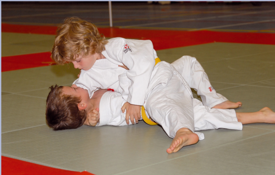
Jeugdverenigingen hoeven toch geen subsidie in te leveren