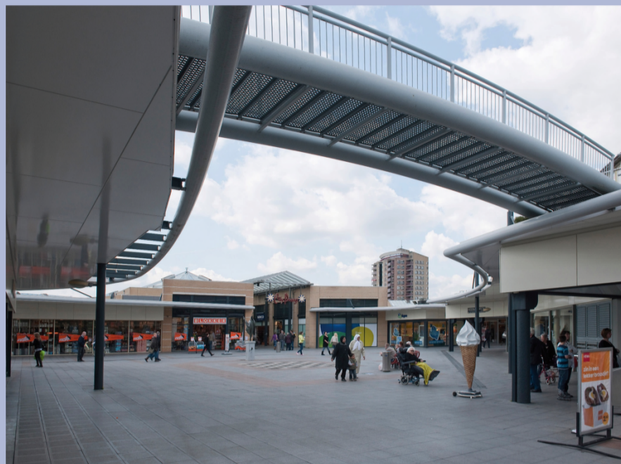
Supermarkten en winkels in Citycentrum, Kromstraat, Mira en Heikant mogen uitbreiden, winkels elders niet