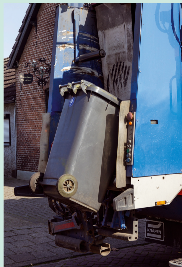
Vanaf 1 oktober krijgen alle Veldhovenaren te maken met een nieuwe manier van afval inzamelen

in de grijze kliko. Tot tevredenheid van Ton Bolsius (CDA), die een gang naar de inzamelpunten fysiek belastend en gênant had genoemd.