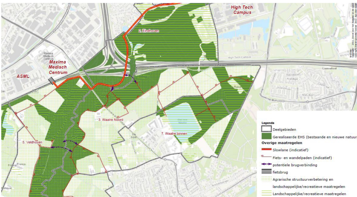
Uitsnede beoogd eindbeeld gerealiseerde EHS, slowlane en recreatieve verbindingen Dommeldal/De Hogt