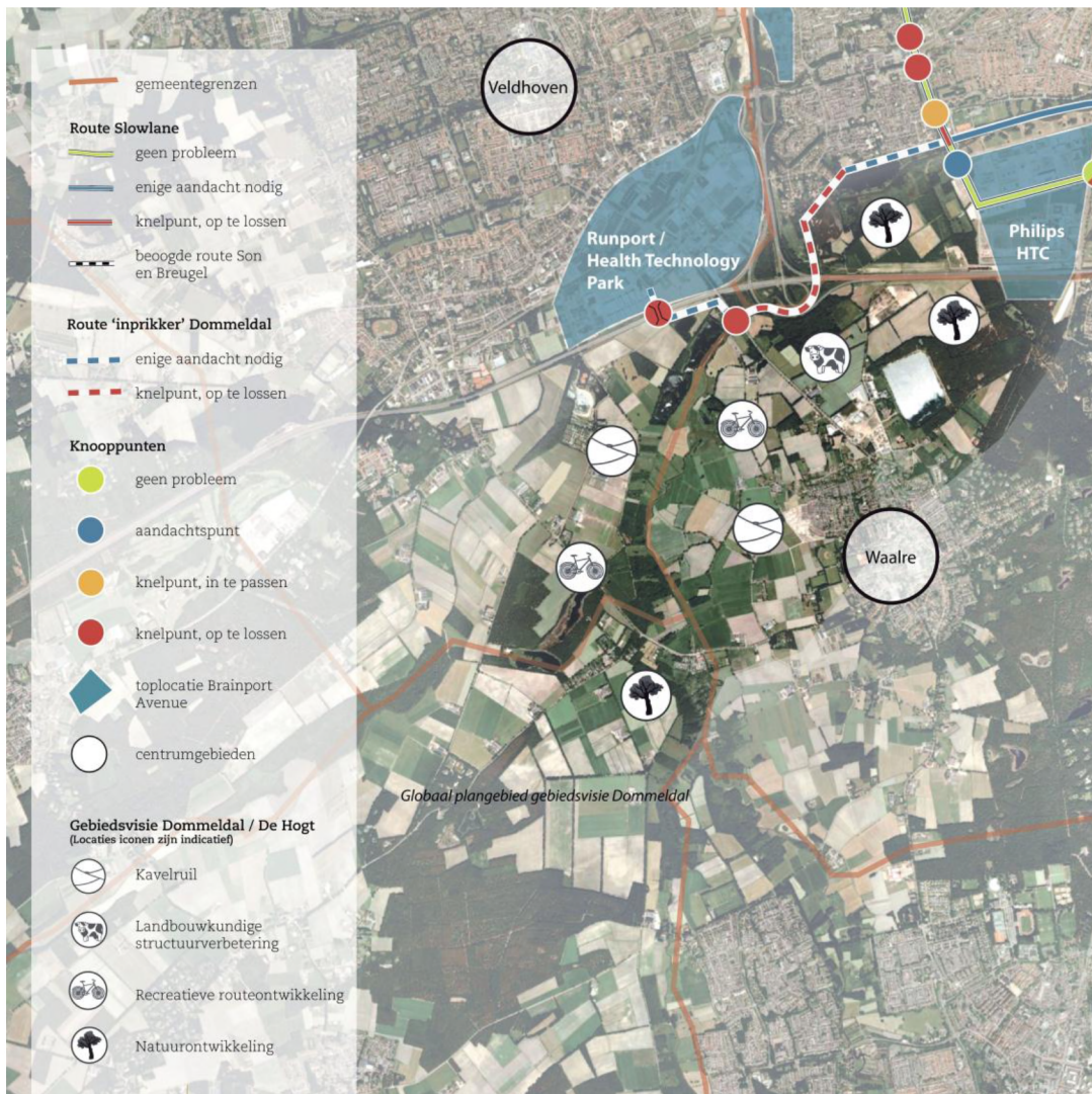
Uitsnede van de mede door de raad vastgestelde visie Slowlane incl. globale gebiedsvisie Dommeldal-de Hogt.