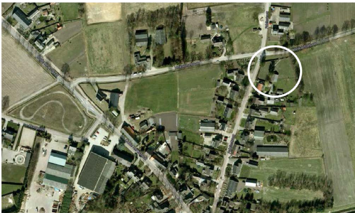
luchtfoto plangebied