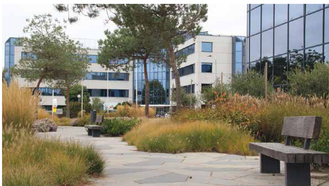
Boulevard van De Run 1000