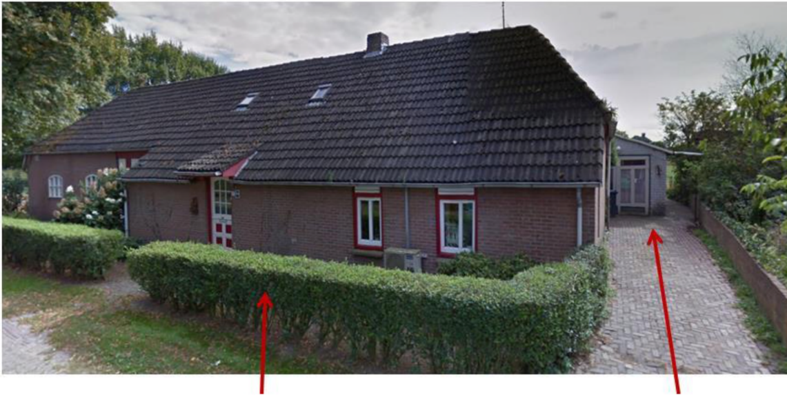
Afbeelding: foto bestaande woning Grote Vliet 19, met aan de zijkant de bestaande woning Grote Vliet 19a.