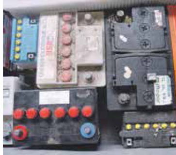
Ook accu's kunt u inleveren bij de chemokar.