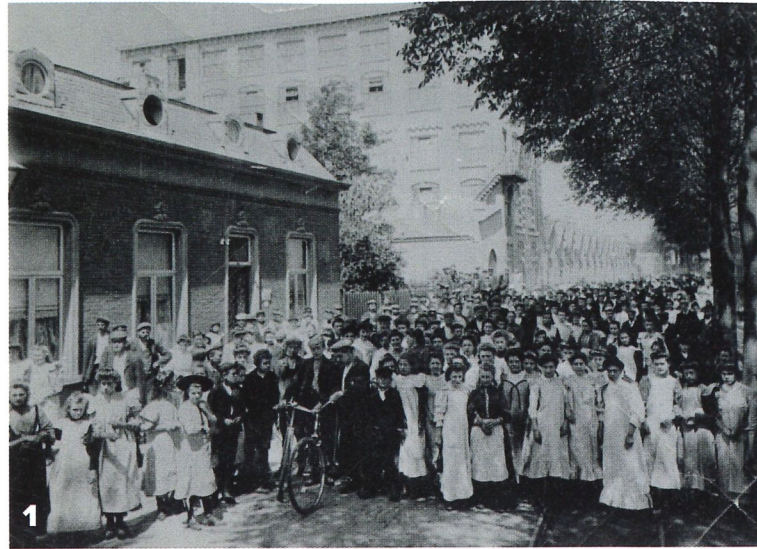
1. HET PHILIPSPERSONEEL IN 1906 2. DE 'SPINBEBOUWING' VAN EINDHOVEN 3. STUDIEZAAL VAN HET RHCE