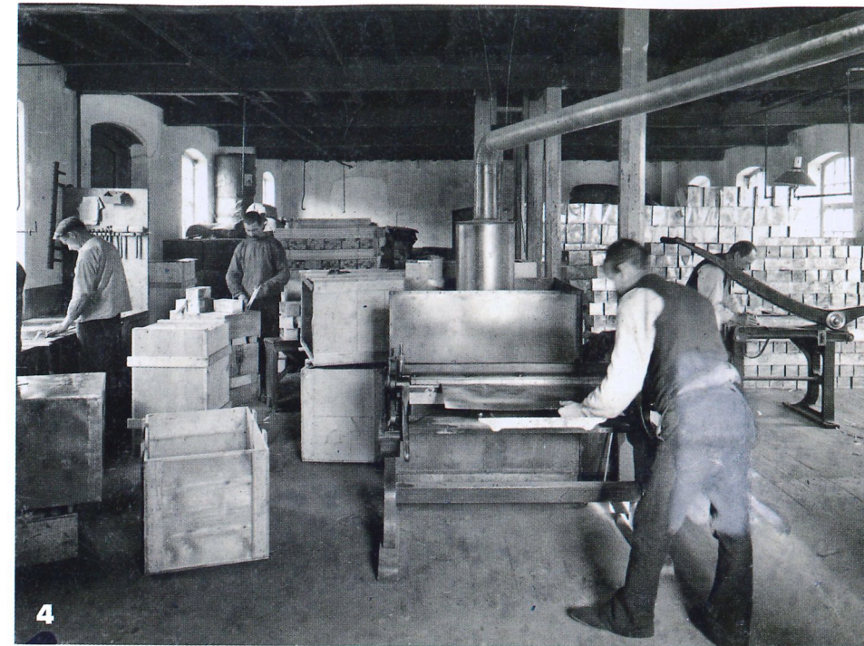
4. BLIKBEWERKING BIJ MIGNOT & DE BLOCK ROND 1900 5. DOCUMENT VAN DE SCHEPENBANK IN HELMOND 6. DE JEUGD OMSTREEKS 1900

Feit is dat al hetgeen het RHCE doet met een bescheiden budget moet worden uitgevoerd. Een aantal jaren geleden hebben de gezamenlijke gemeenten de begroting met ongeveer 25 procent gekort. Men moet het nu zien te redden met een bedrag van circa drie miljoen euro. Dat is gezien alle taken die vervuld zouden kunnen worden wat weinig. Er zat niets op dan te snijden in activiteiten als tentoonstellingen, cultuureducatie en symposia. Ook zijn de openingstijden van de bezoekersruimte sinds vorig jaar teruggebracht naar het niveau van vóór 2015. Dat betekent dezelfde dienst-