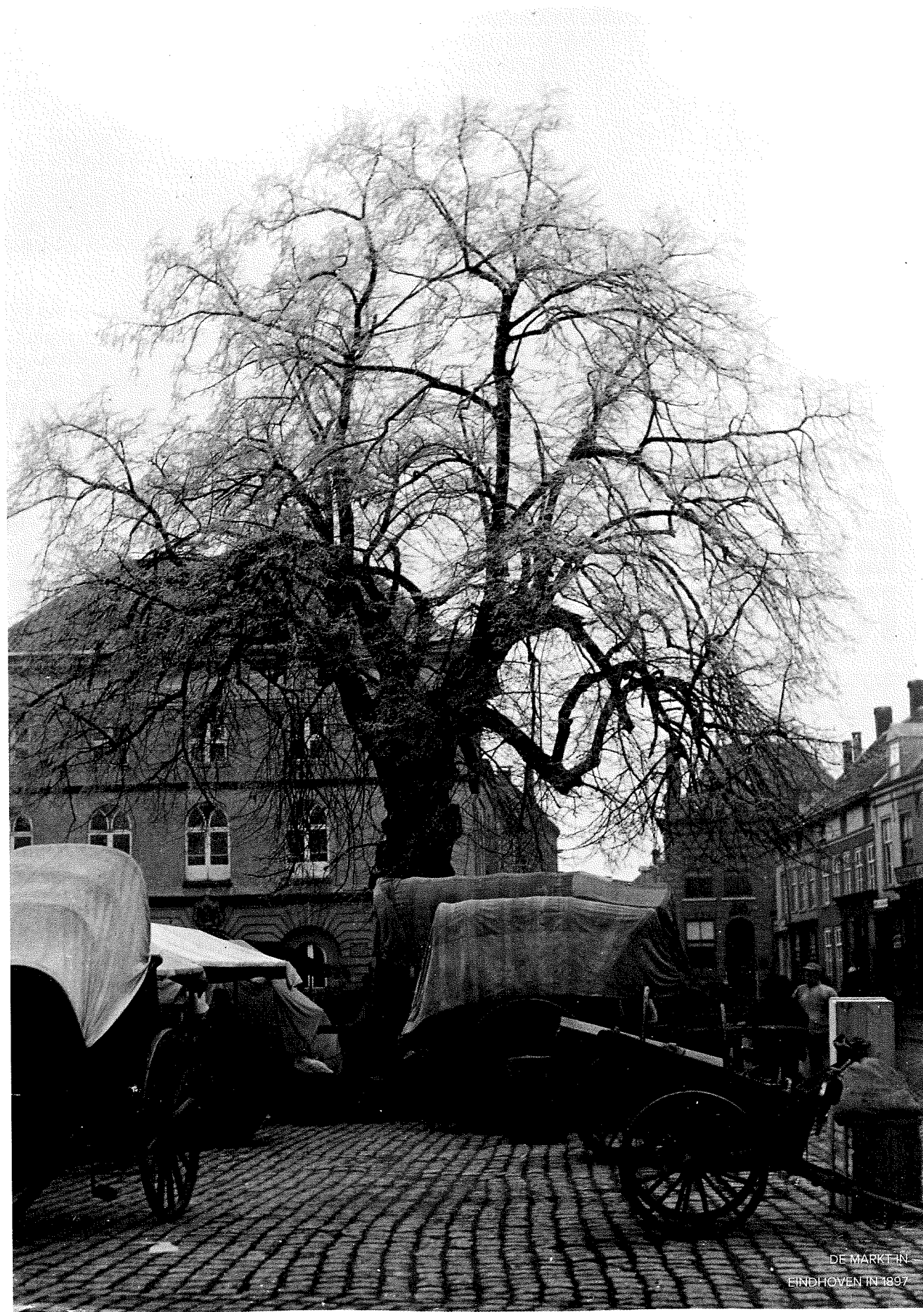
DE MARKT IN EINDHOVEN IN 1897