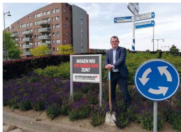
Afgelopen week zijn de eerste reclameborden geplaatst op de rotonde Meerhovendreef/Traverse

Sinds enige tijd kunnen bedrijven een Veldhovense rotonde – geheel of gedeeltelijk – 'adopter' voor bedrijfspromotie. Het bedrijf mag daar dan, tegen betaling van een vergoeding, een of meer reclameborden plaatsen met bedrijfsnaam en logo.