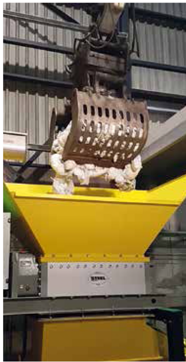
Een flinke hap luiers verdwijnt in de machine.

Onafhankelijk onderzoeksbureau CE Delft vergeleek de nieuwe methode met de gebruikelijke verwerking in een AfvalEnergieCentrale (AEC). Zo'n centrale verbrandt huisvuil (met daarin ook luiers) om energie op te wekken. CE Delft concludeert dat de nieuwe methode een klimaatwinst oplevert van 480 kilo CO 2 per ton verwerkt luiermateriaal.