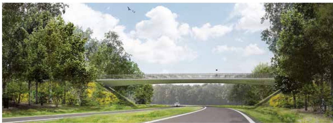
Impressie van de fietsbrug