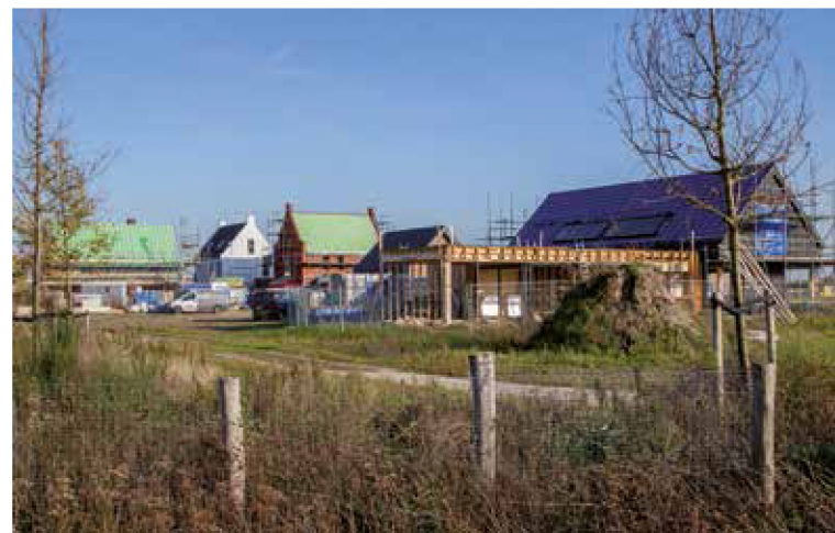
Huysackers krijgt al vorm.

ter' (NOM-)woningen. Deze woningen wekken evenveel (of meer) energie op als wat nodig is voor het huis en het huishouden. De woningen in Huysackers krijgen geen gasaansluiting.