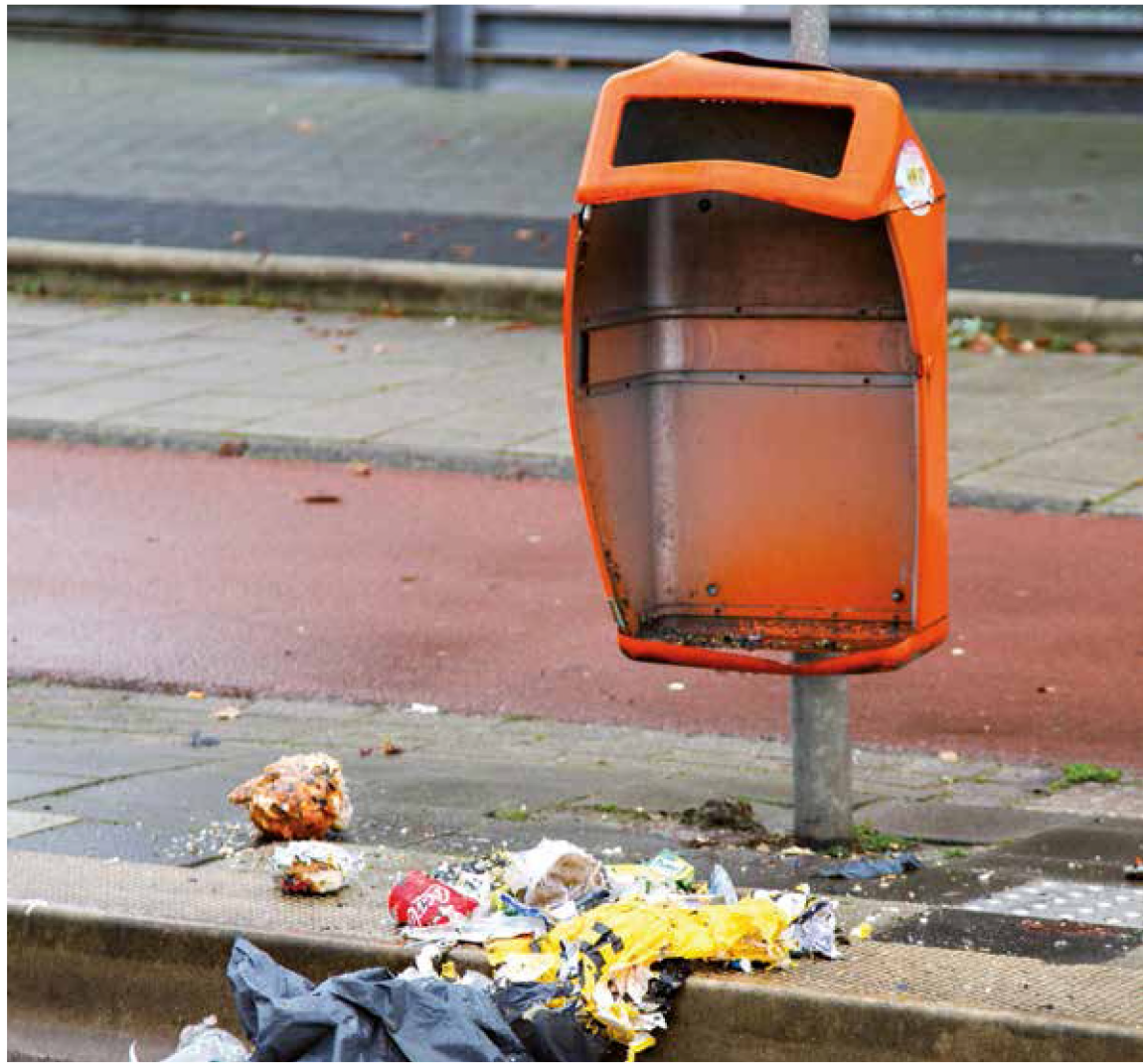
Een voorbeeld van vuurwerkschade

De jaarwisseling komt dichterbij en de vuurwerkkriebels nemen toe. Vuurwerk kan zeker erg mooi, leuk en spannend zijn, maar brengt helaas ook risico's met zich mee. Er kan door vuurwerk (ernstig) lichamelijk letsel of schade ontstaan. Ook kan overlast ontstaan door het afsteken ervan. Houd rekening met elkaar.