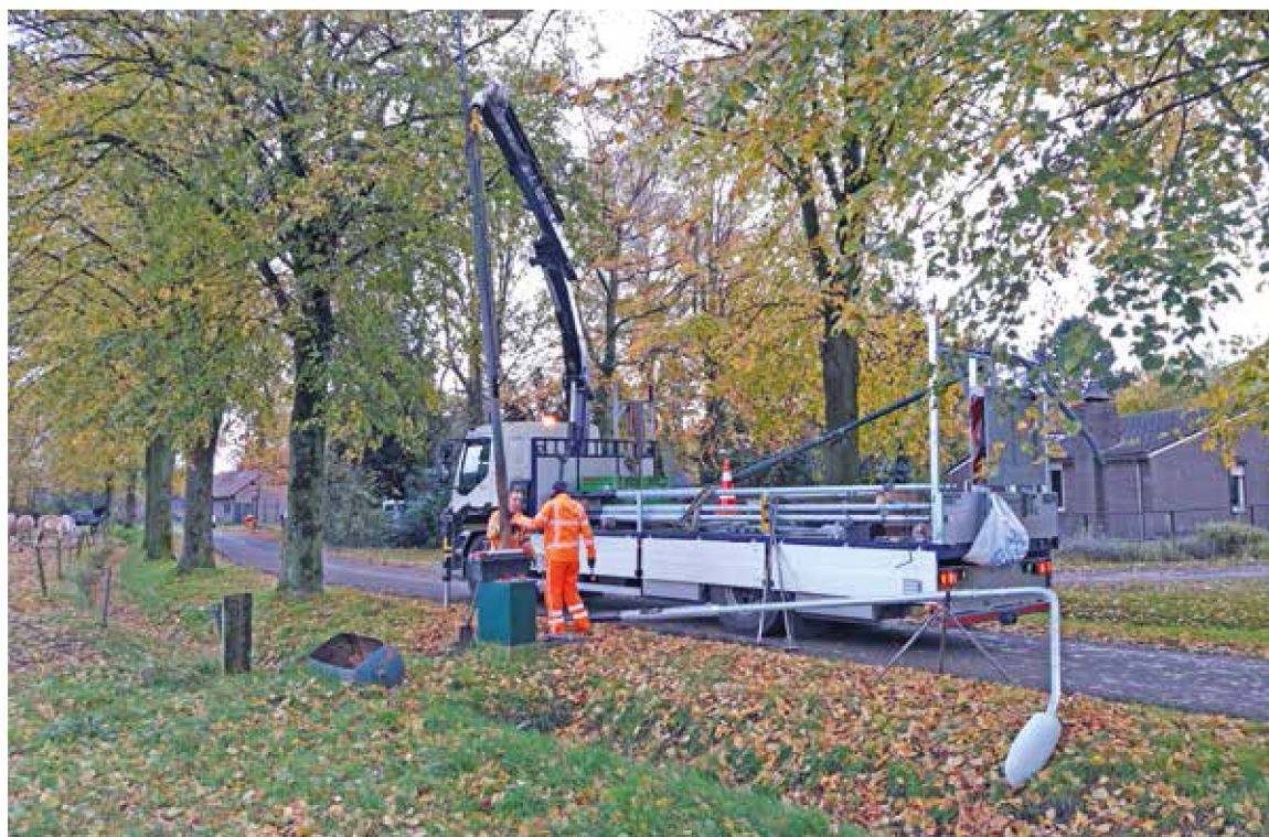
Vervanging van een lichtmast

Veldhoven krijgt 480 nieuwe verlichtingsarmaturen (de houder en de lamp) met led-sstraatverlichting. Het vervangen van de straatverlichting start op 25 mei met lichtmasten aan de Heerbaan. Naar verwachting is de aannemer uiterlijk september klaar.