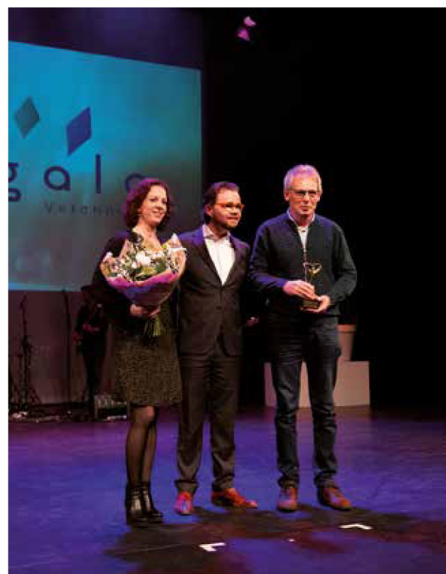
Eervolle vermelding voor Stichting de Stalvrienden