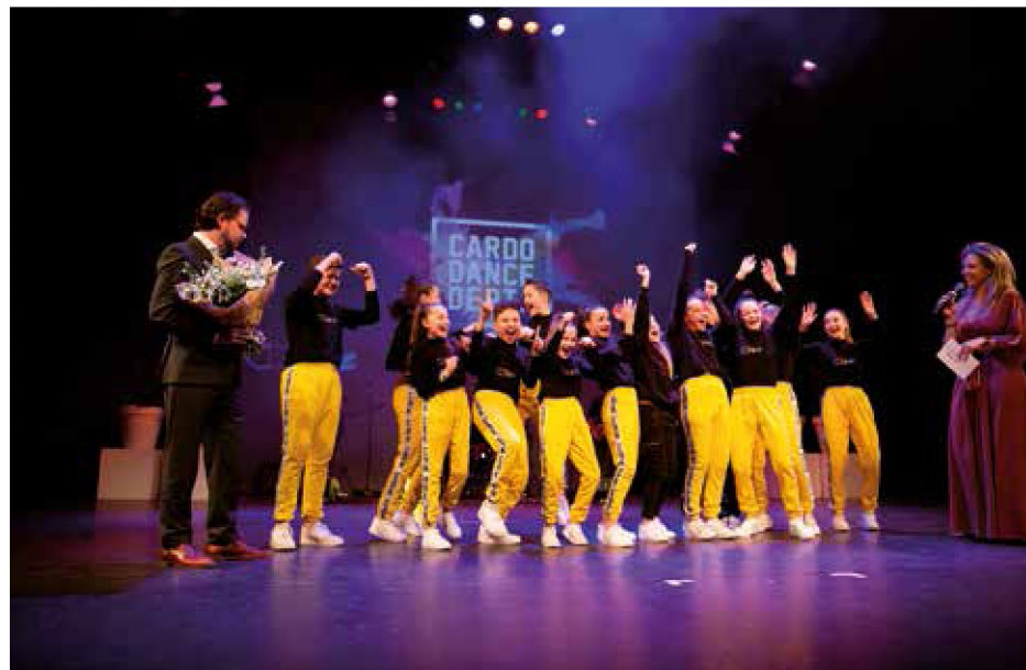
De hiphoppers van CD Kidz