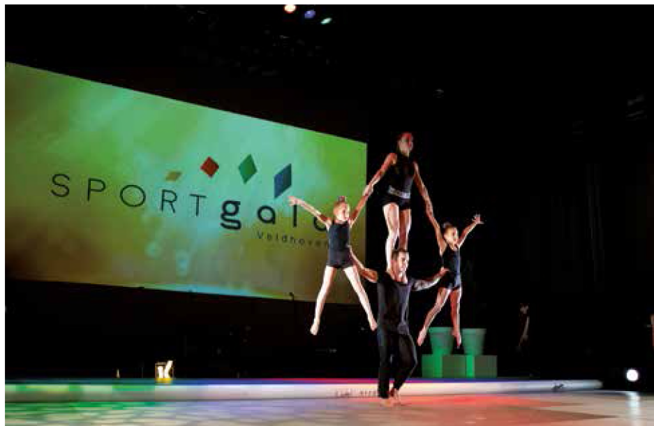
Optreden acrogym Voorwaarts