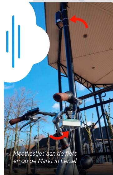
Meetkastjes aan de fiets en op de Markt in Eersel