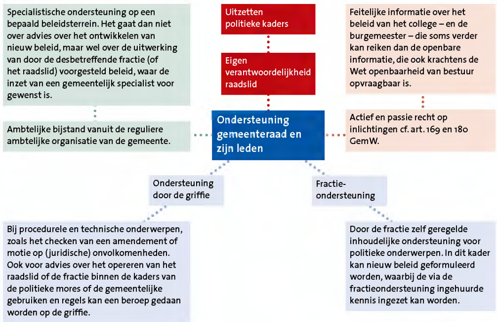
Figuur Ondersteuning gemeenteraad en zijn leden 21

Naast dit systeem van inhoudelijke ondersteuning staat de onafhankelijke rekenkamer. 22 De introductie van de rekenkamer op decentraal niveau was één van de aanbevelingen van de Staatscommissie Dualisme en lokale democratie. 23 De Staatscommissie achtte de instelling van onafhankelijke rekenkamers noodzakelijk als onderdeel van de door haar bepleite versterking van de controlerende taak van de gemeenteraad en provinciale staten. Gedegen, onafhankelijk rekenkameronderzoek naar de doeltreffendheid, doelmatigheid en rechtmatigheid van het gevoerde bestuur zou de decentrale volksvertegenwoordiging in staat stellen om in de gedualiseerde verhoudingen de controle te verbeteren op de bereikte effecten van beleid en de besteding van middelen.