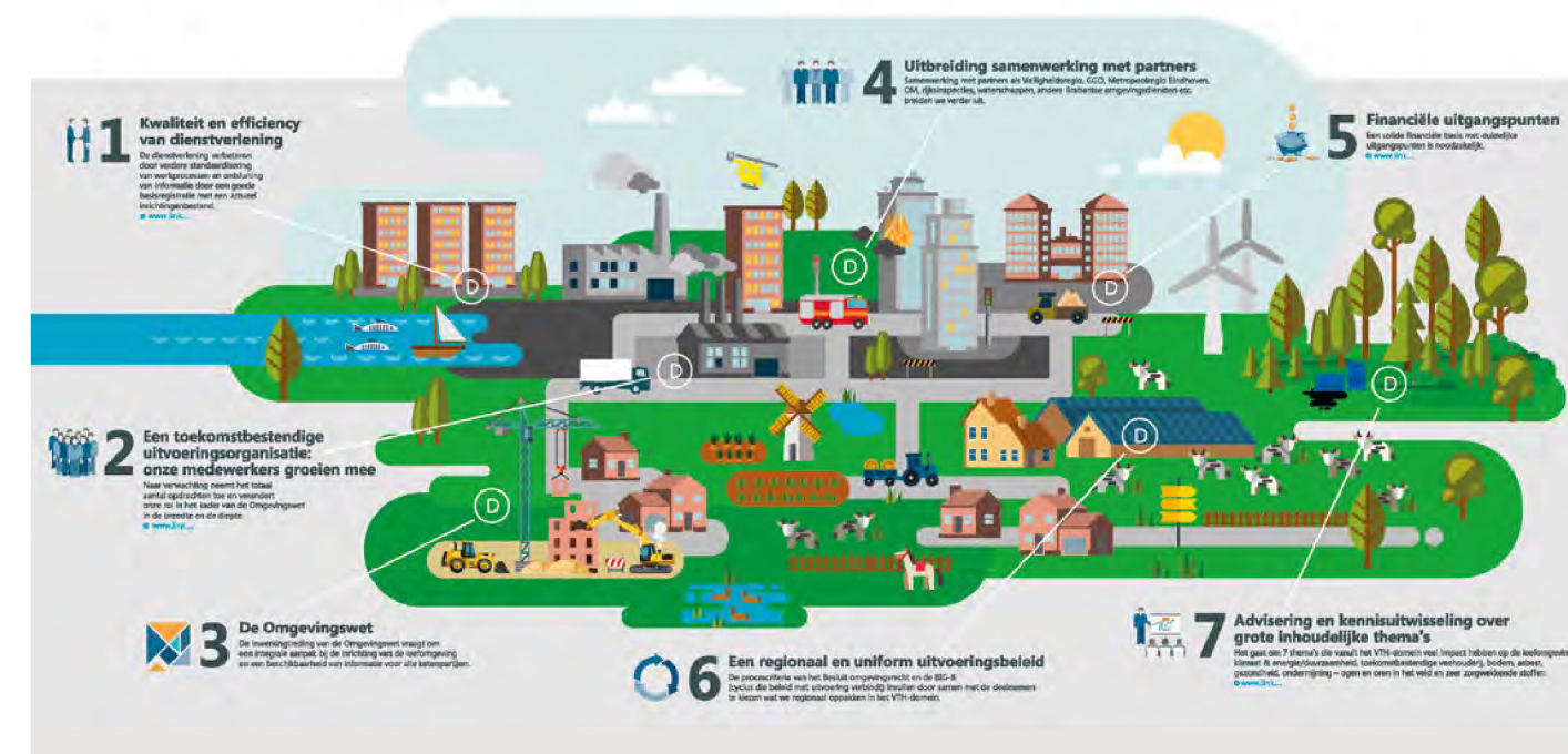
Figuur 1: infographic Concernplan Omgevingsdienst Zuidoost-Brabant