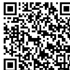
Monitor Brede Welvaart