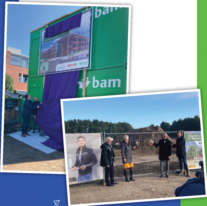
In 2022 startte in Helmond en Veldhoven de bouw van de eerste gestandaardiseerde sociale huurwoningen vanuit het project WoonST

Binnen de werkgroep GREX zijn de specialisten op het gebied van grondexploitaties verenigd. Het afgelopen jaar is een onderzoek van de gezamenlijke grondprijsystematiek voor sociale huurwoningen uitgevoerd, dit tegen het licht van de ontwikkelingen sinds de invoering in 2015. Tevens is een overzicht gemaakt van het zogenaamde flankerend beleid. Enerzijds om dit van elkaar inzichtelijk te hebben, tevens om te kijken naar harmonisatiemogelijkheden zodat wanneer een gemeente de keuze maakt voor een maatregel, deze uniform is.