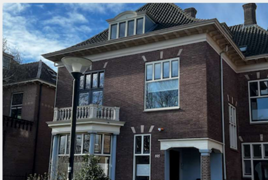
Voorbereid op de loopbaantoekomst