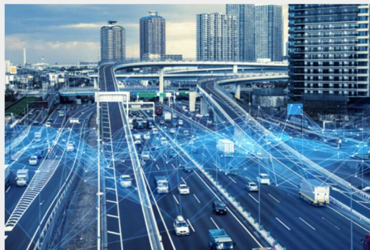
Nederlandse infrastructuur in 2030