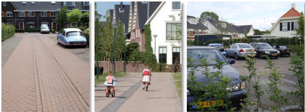
figuur 5. Referentie openbare ruimte: woonstraat (links, midden), parkeerhof (rechts).

Het streven is om parkeervoorzieningen in het dorps milieu te passen door zoveel mogelijk 'blik op de weg' te voorkomen, bijvoorbeeld middels kleine en grote parkeerhofjes achter de woningen. Ook het zoveel mogelijk parkeren op eigen terrein zorgt ervoor dat de auto's uit het zicht blijven. In principe wordt alleen het bezoekersparkeren in het openbaar gebied gerealiseerd. Voor rijenwoningen worden indien financieel mogelijk gemeenschappelijke parkeerplaatsen gemaakt, bijvoorbeeld op binnenterreinen of in parkeerkoffers. Voor het bepalen van het aantal benodigde parkeerplaatsen (de parkeernormering) worden de CROW-kencijfers gebruikt (zie tabel 2 op pagina 10).