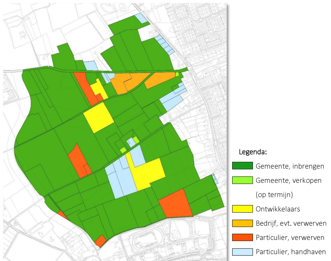
figuur 8. Strategie verwerving.

Ten slotte kan met de ontwikkelaars die een grondpositie hebben in het gebied tot afspraken worden gekomen, zodat deze percelen niet aangekocht hoeven te worden. In totaal betreft dit 4,8 ha. Met de ontwikkelaars wordt afgesproken dat zij hun gebieden (voor zover voorzien van woonbestemming) zelf ontwikkelen en een bijdrage doen voor de realisatie van voor de wijk benodigde (verkeers)voorzieningen.