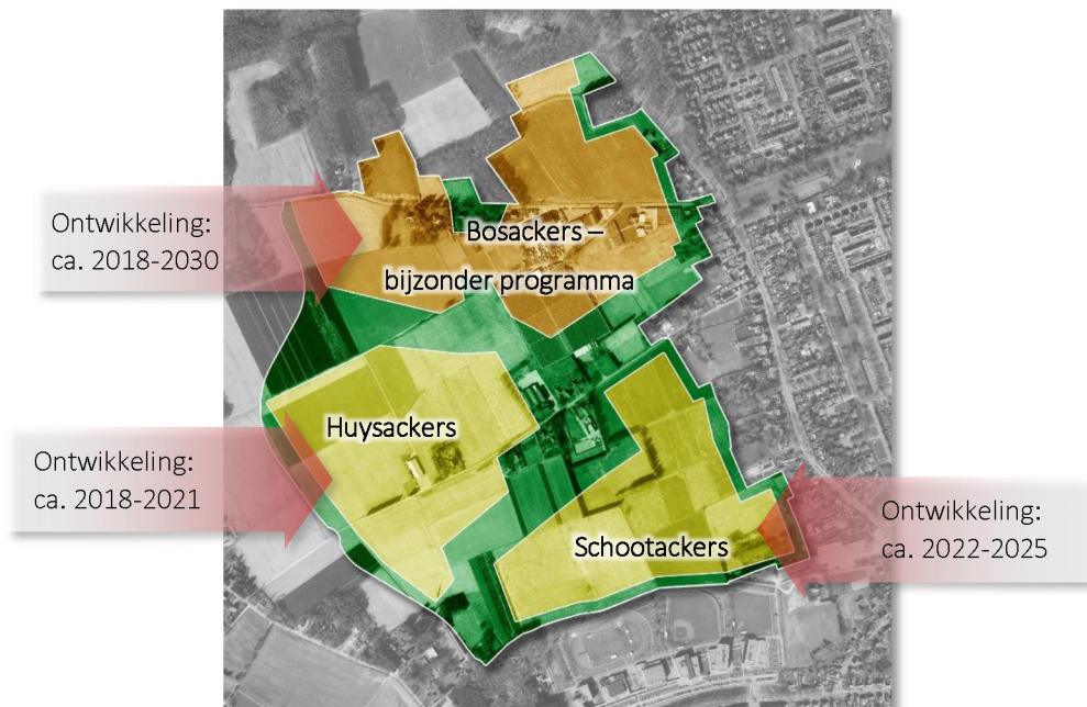
figuur 7. Voorbeeld: alternatieve invulling ontwikkeling van De Drie Dorpen

sico's die marktpartijen op lange termijn zien worden verdisconteerd in afspraken voor de korte termijn.