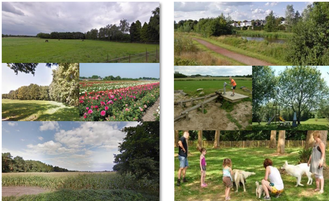
figuur 6. Referentie groenstructuur: agrarische functies in landschap (links) combineren met 'stedelijke' groenfuncties zoals waterberging, spelen en hondenuitlaat (rechts).

De ambitie is om in de groenstructuur verschillende functies onder te brengen: bijvoorbeeld bestaande bomen/cultuurhistorie, hemelwaterinfiltratie, speelplaatsen, paardenweide, moestuin, hondenuitlaatterrein, picknickplaatsen, boomgaard, een kleinschalig trimcircuit, etc. In het ontwerp worden karakteristieke landschappelijke en cultuurhistorische kenmerken (houtwallen, padenstructuur en bebouwing) mogelijk gehandhaafd en opgenomen.