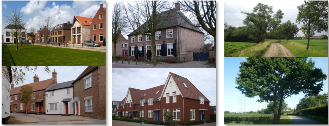
figuur 4. Indicatie: van kern met dichtere bebouwing (links) naar ruimere opzet in de mantel (midden) naar agrarisch gemêleerd landschap tussen de dorpen (rechts).

Voor de openbare ruimte heeft de gemeente de ambitie om deze kwalitatief hoogwaardig in te richten. De straten geven een landelijk/dorps beeld. Op de hoofdwegen staan (laan)bomen in gras/groenvakken en naast greppels aan één of weerszijden van de weg. In de kom van de dorpen worden hardgebakken klinkers gebruikt als bestratingsmateriaal. Trottoirs zijn onderdeel van het straatprofiel (op gelijk niveau waarbij rekening moet worden gehouden met een bepaalde opvangcapaciteit van hemelwater binnen de profielen/erf) met uitzondering van de hoofdroutes. Bomen worden gekozen uit het (inheemse) assortiment dat typerend is voor de Kempen zoals eiken, berken, beuken, lindes etc. Zo sluit het groen binnen de dorpen aan op het groen buiten de dorpen en vormen de dorpen dus een geheel met het landschap. Bij de keuze van de boomsoort en overig groen wordt rekening gehouden met toekomstig (efficiënt) onderhoud.