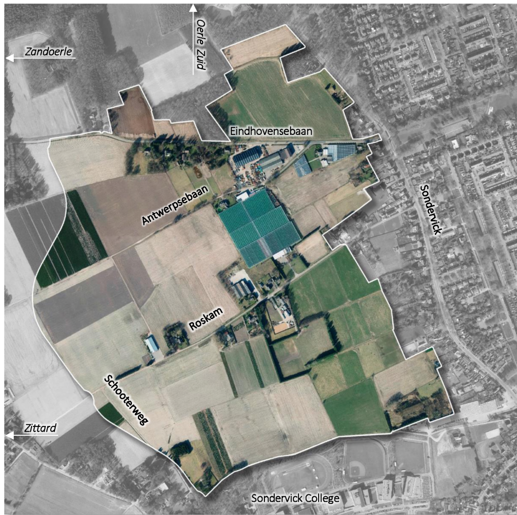
figuur 2. Luchtfoto van de huidige situatie in het plangebied De Drie Dorpen.

Het gebied waar De Drie Dorpen ontwikkeld gaan worden is op dit moment voornamelijk in gebruik voor agrarische doeleinden (zie figuur 2). Daarnaast bevinden zich aan de wegen die door het plangebied lopen (Eindhovensebaan, Antwerpsebaan, Roskam en Schooterweg) enkele woningen. In het gebied is daarnaast nog een tuinder, een glastuinbouwbedrijf, een transportbedrijf en een Boerenbond aanwezig.