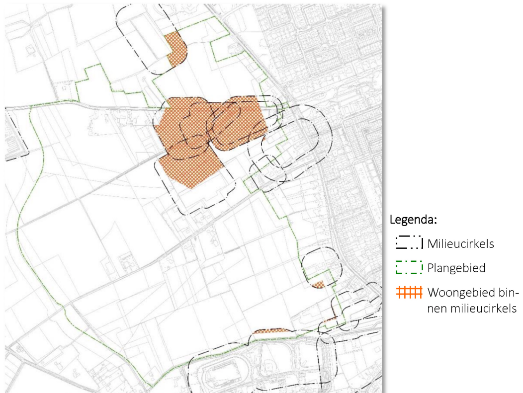
figuur 3. Milieucirkels in het plangebied. Het gearceerde gebied heeft een uit te werken woonbestemming maar ligt binnen bestaande milieuhindercircels.

Op het perceel kadastraal bekend bij de gemeente Veldhoven onder sectie c, nummer 1127, staan een aantal bomen ten dienste van een bomenkwekerij. Op het perceel rust een hindercirkel (spuitcirkel) van 50 meter, deze ligt deels binnen het plangebied. Aan de noordwestzijde van het plangebied ligt de gemeentelijke begraafplaats De Hoge Boght. In 2016 wordt hier een crematorium gerealiseerd. Deze begraafplaats en crematorium heeft op basis van het thema geluid een afstand van 10 meter, voor het thema geur ontstaat door de komst van het crematorium een afstand van 100 meter. De hindercircels vanuit begraafplaats en crematorium komen niet tot in het plangebied.