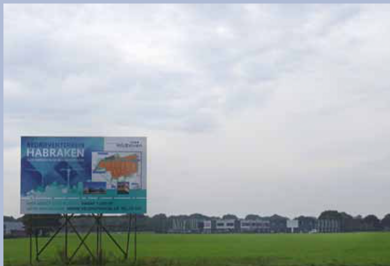
Ook ondernemers worden afgeschrikt door de OZB-stijging

bouwen aan een mooi en financieel gezond Veldhoven. Bijna alle partijen hebben in hun verkiezingsprogramma het laag houden van de woonlasten als verkiezingsbelofte gedaan. De inkt van de programma's is nog nauwelijks droog en het college stelt voor de OZB fors te verhogen. De VVD doet hier niet aan mee. Als we denken op deze manier het vertrouwen van de burger terug te krijgen,