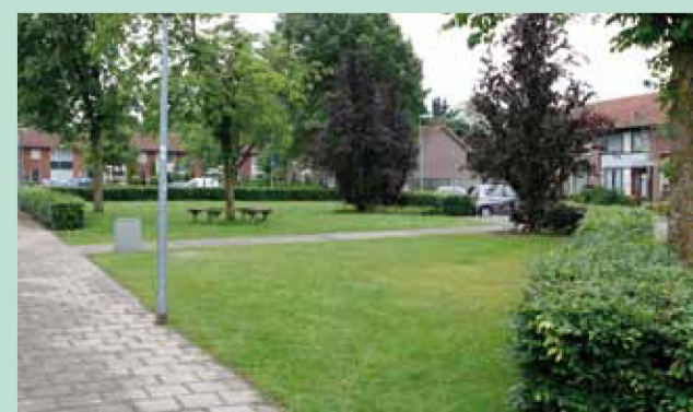
Onderzoek de mogelijkheden van groenonderhoud door particulieren

Het streven is om de totale woonlasten (OZB, riool- en afvalstoffenheffing) voor onze Veldhovense huizenbezitters gelijk te houden. De eerste berichten van de proef rond gescheiden afvalinzameling in Zeelst en Meerveldhoven laten zien dat hiermee geld te besparen is. De proef zou uitgerold moeten worden over heel Veldhoven. En met een goede communicatie naar de burgers over het scheiden van afval, kunnen nog betere resultaten behaald worden.