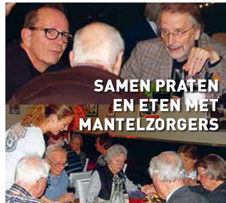
SAMEN PRATEN EN ETEN MET MANTELZORGERS

Het coalitieakkoord onderschrijft dat iedereen de zorg en ondersteuning krijgt die nodig is. Dat zie je terug in de begroting 2019. Daar staat ook het voornemen het echte gesprek aan te gaan met aanbieders en cliënten om zo toekomstbestendig zorgbeleid te kunnen maken. 'n Goede zaak!