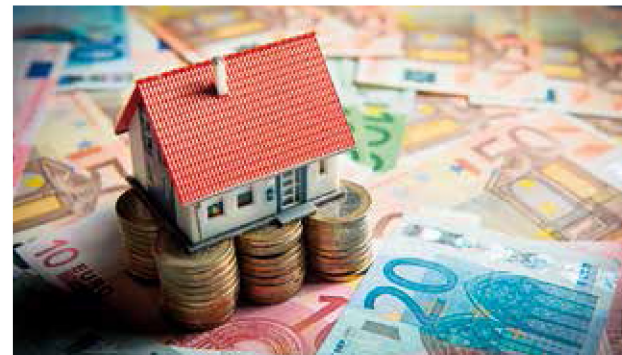
De coalitie stelt voor de komende vier jaar een stijging voor van de OZB met 30%. Lokaal Liberaal wil 0% verhoging.