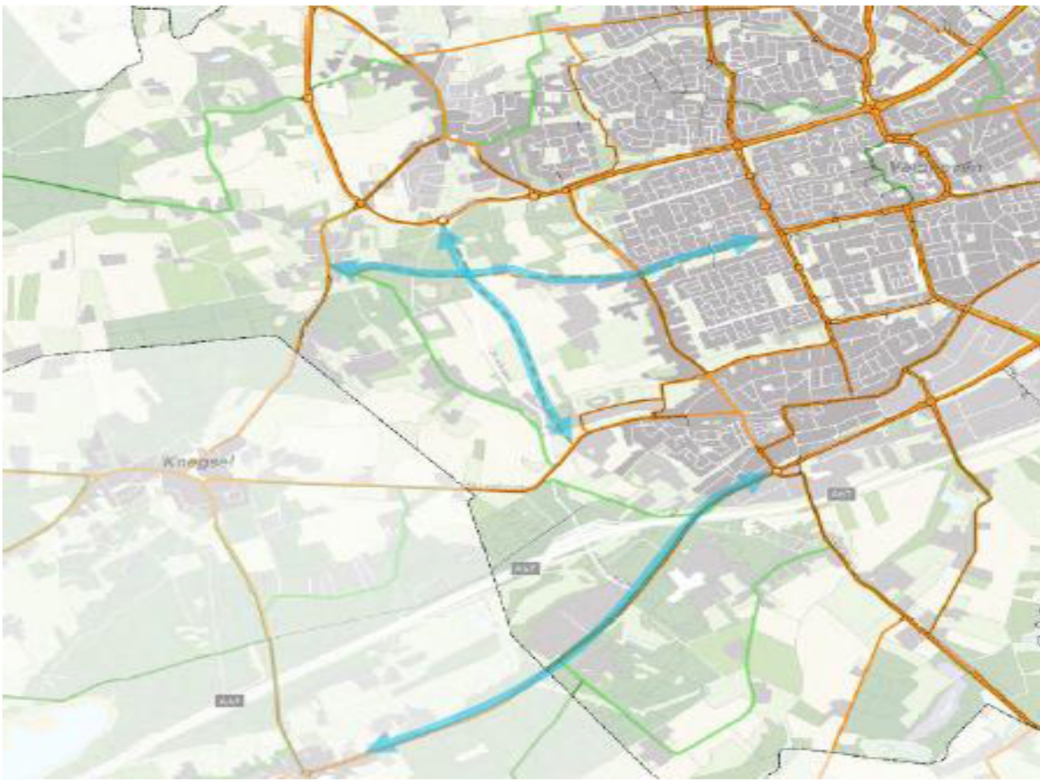
GVVP_22 februari 2018 _ Fiets pagina 11_Blz. 47