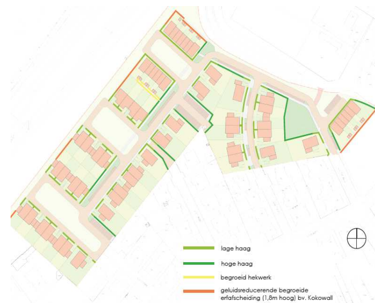
Afbeelding over erfafscheidingen uit beeldkwaliteitsplan