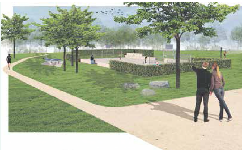
Sfeerbeeld van het terrein voor sportactiviteiten

Volwassenen én kinderen zijn van harte welkom op een moment dat schikt. Koffie, thee en ranja staan klaar!