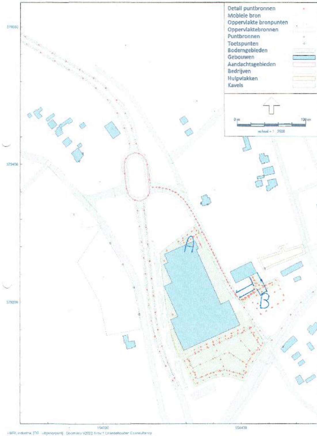
Afbeelding 2: Getoonde tekening door indiener tijdens overleg 6-4-2023