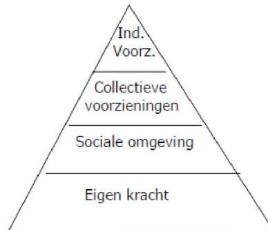
Figuur: Opbouw van ondersteuningsarrangement: van onder op (ind.voorz. = individuele voorzieningen).

Bij het bespreken van mogelijke oplossingen voor de ondersteuningsbehoefte van de burger komen deze achtereenvolgens aan bod. Alle maatregelen die denkbaar en uitvoerbaar zijn, kunnen worden ingezet om het beoogde resultaat te bereiken. De nadruk ligt op zelfredzaamheid en betrokkenheid bij de samenleving. Bij het zoeken naar oplossingen voor de ondersteuningsbehoefte van de burger denken we dan ook vanuit de eigen kracht van de burger en zijn sociale omgeving. Met eigen kracht bedoelen we wat de burger zelf kan doen en organiseren om te blijven meedoen.