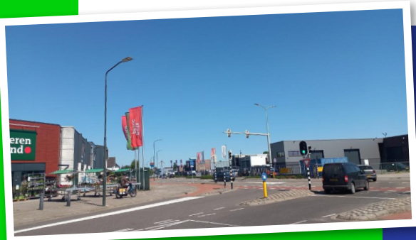
Intensiveren op bestaande bedrijventerreinen is een belangrijke, maar geen eenvoudige opgave

Op dit moment werkt het thema Economie aan de uitwerking van de Visie Werklocaties. Er wordt gekeken naar locaties voor nieuwe bedrijventerreinen, naar methoden om selectief te zijn bij de uitgifte van bedrijfslocaties, maar ook naar een kwaliteitsslag en inventarisering op bestaande bedrijventerreinen. Verder leggen de portefeuillehouders Economie dit najaar de nieuwe detailhandelsvisie ter besluitvorming voor bij de negen gemeenteraden. Als daarop akkoord wordt gegeven gaan zij verder met de uitvoering daarvan en met de doorontwikkeling van de Regionale Advies Commissie Detailhandel (RACD).