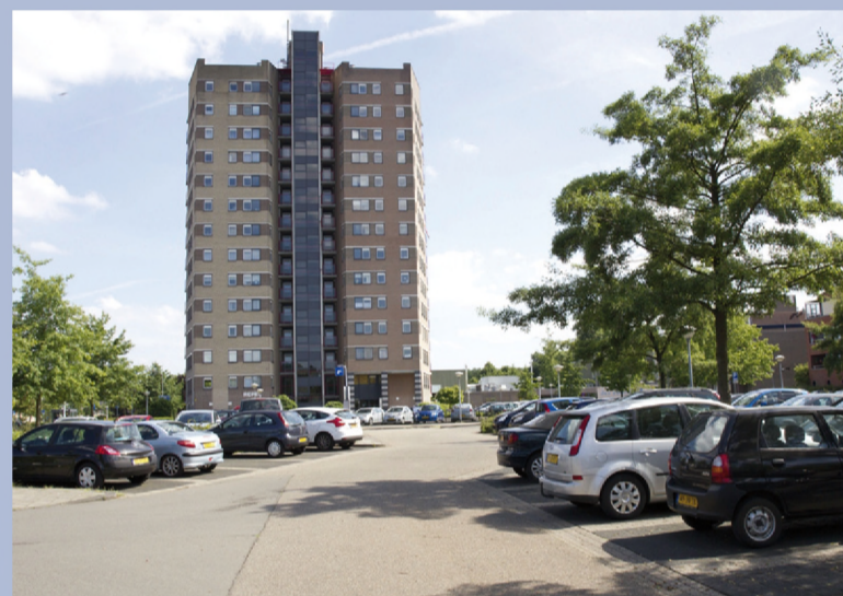
Parkeerterrein Repel krijgt nieuwe automaten met pin en u kunt straks belparkeren

Bij andere fracties viel het voorstel minder goed in de smaak, waardoor het geen kans maakte. Het parkeren van het betaald parkeren tot 24.00 uur zou in elk geval verkeerd vallen bij de eigenaar van de servicebioscoop, waarschuwde wethouder Ramaekers.