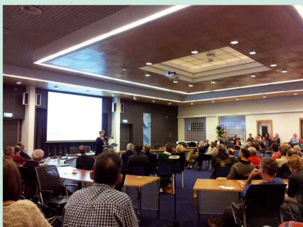
Tijdens de raadsavond over het sociaal domein

sociale domein. Naast de adviestaak staan binnen 'Veldhoven aan tafel' het wederzijds inspireren en aangaan van de dialoog centraal."