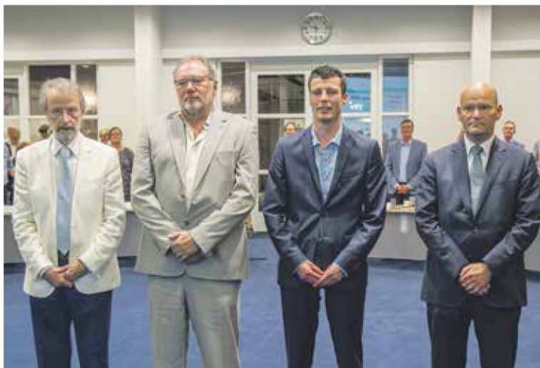
Vier nieuwe raadsleden worden toegelaten tot de raad door de benoeming van de nieuwe wethouders. V.l.n.r. Hofmeester, Groenendijk, Van Oorschot, Van Daele

Elke fractie mag maximaal drie personen afvaardigen in de steunfractie. Ook zij leggen de gebruikelijke eed of belofte af. De steunfractieleden ondersteunen de fractie bij het raadswerk.