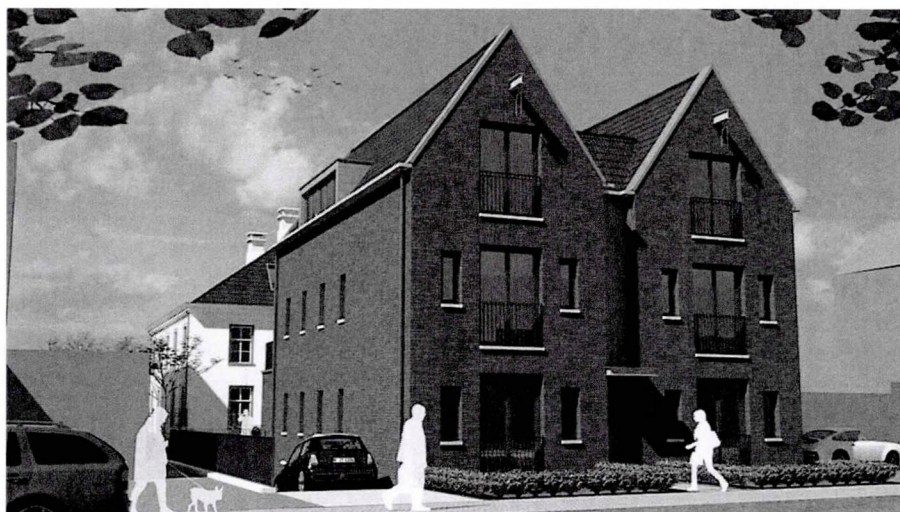
Afbeelding 2: Impressie nieuw appartementengebouw aan de Kerkweg.

initiatiefnemers een appartementengebouw voor zes woningen en een parkeerkelder realiseren. Tussen het rijksmonument en het appartementengebouw zal een binnentuin worden gerealiseerd.