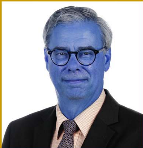
Burgemeester gemeente Waalre Voorzitter basisteam Kempen

De zorg voor veiligheid is een kerntaak van de gemeente. Die verantwoordelijkheid dragen we samen met vele partners. Veiligheid is veel omvattend en gaat om zaken waar inwoners dagelijks (bewust en onbewust) mee te maken krijgen. Denk daarbij aan veiligheid tijdens grote evenementen of de wetenschap dat de brandweer op tijd arriveert bij een brand, maar ook vervelende zaken zoals fietsendiefstal, woninginbraak, geweldpleging of de verwevenheid van de onderwereld met de bovenwereld. Veiligheid is een basisvoorwaarde voor een aantrekkelijke woon-, werk- en leef- gemeente en voor een goede economische en sociale ontwikkeling. De gemeente moet niet alleen veilig zijn, inwoners moeten zich ook veilig voelen.