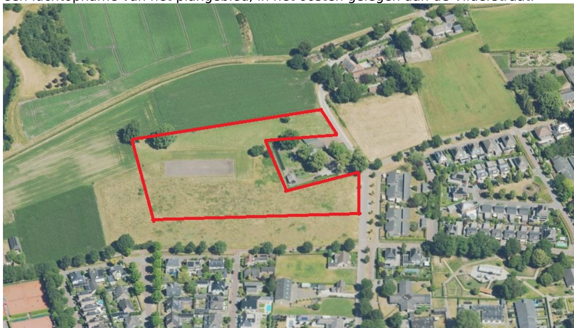
Afbeelding 1: luchtopname van het plangebied, het plangebied rood omlijnd.

Het college wil meewerken aan een bestemmingsplanherziening om de bouw van twee vrijstaande woningen aan de Vilderstraat mogelijk te maken. Aan beide zijden van de bestaande woning aan de Vilderstraat wordt één nieuwe woning mogelijk gemaakt, het achterliggende deel krijgt een natuurbestemming. Het plangebied ligt in het landelijk gebied, dat betekent dat een investering in de omgevingskwaliteit vereist is. Dit wordt zoveel mogelijk lokaal ingevuld: het achterliggende gebied wordt openbaar toegankelijk en krijgt een groene bestemming. Dit gebied wordt groen ingericht met streekeigen beplanting, en vormt daarmee een eerste stap richting het door de gemeente gewenste groene uitloopgebied ten noorden van Oerle. Afbeelding 1 toont een luchtopname van het plangebied, in het oosten gelegen aan de Vilderstraat.