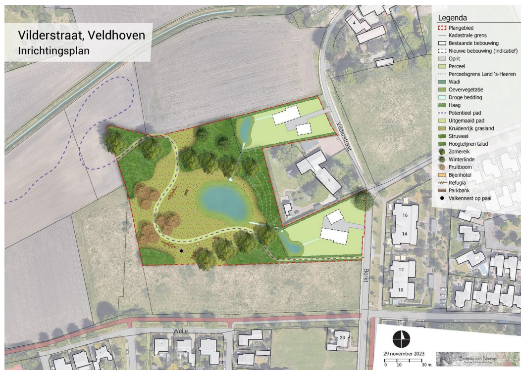
Afbeelding 3: impressie toekomstige inrichting achterliggende perceel

De kosten van inrichting en beheer van de kwaliteitsverbetering zijn berekend op €68.564,68. Het resterende deel van de verplichte € 250.000,- wordt besteed aan ruimte-voor-ruimte (deel)titels. In de bijlagen van het bestemmingsplan zit een gedetailleerde (financiële) toelichting op de kwaliteitsverbetering.