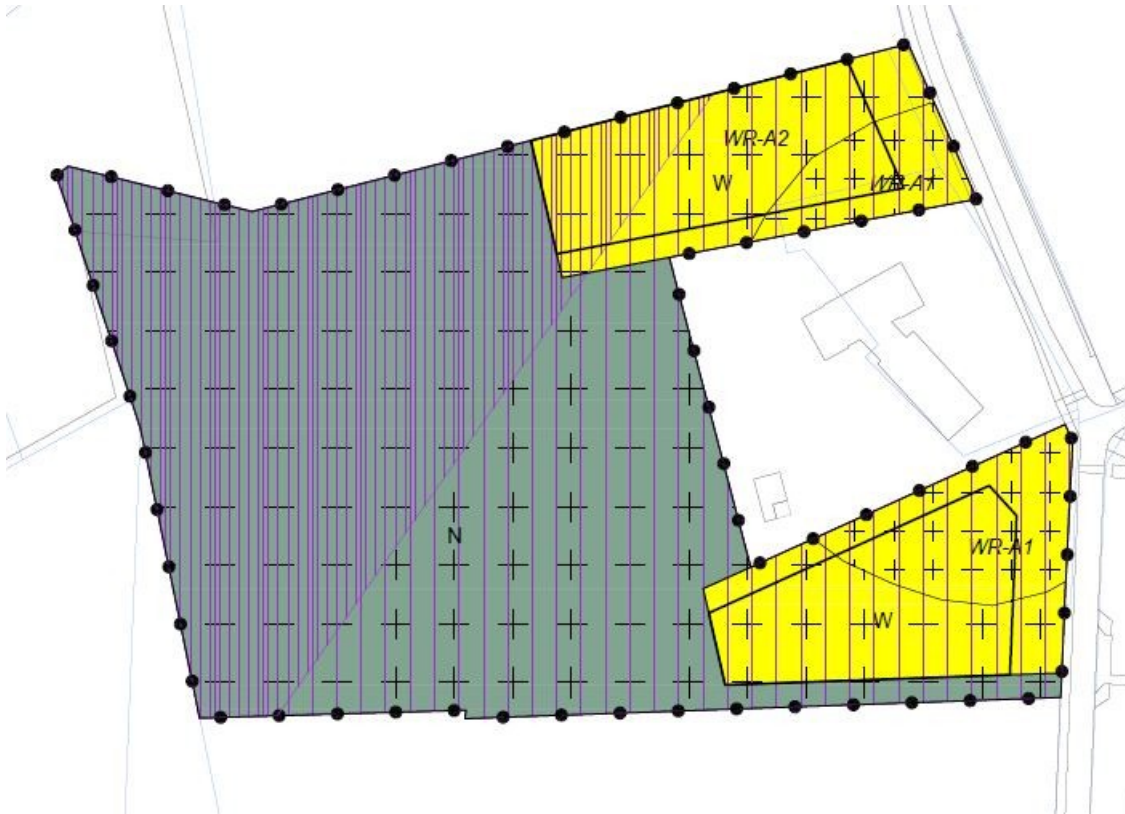
Afbeelding 2: uitsnede verbeelding.

Tijdens de terinzagelegging van het ontwerpplan zijn twee zienswijzen ingediend. Naar aanleiding van de ingediende zienswijzen is het plan in goed overleg met de indieners aangepast, waarna één zienswijze is ingetrokken. Afbeelding 2 toont de uiteindelijke verbeelding bij het bestemmingsplan. Het deel van het plangebied waarop de landschappelijke kwaliteitsverbetering is voorzien krijgt een natuurbestemming. Het wordt toegankelijk via een pad naar de Vilderstraat.